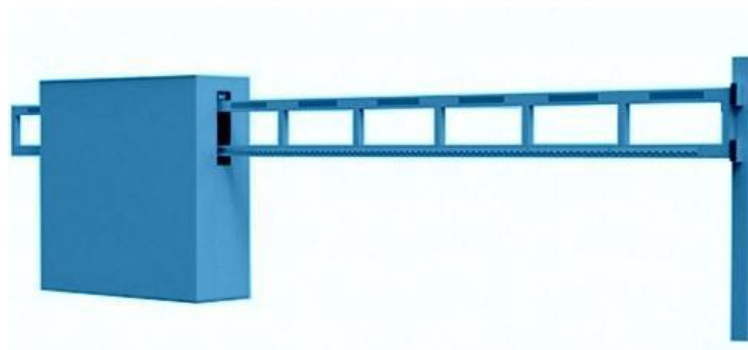
Рис. 3 Внешний вид шлагбаума откатного

2.3. Внешний вид шлагбаума Стойка шлагбаума снабжена сигнальной лампой желтого цвета для предупреждения водителей транспортных средств и пешеходов о движении стрелы шлагбаума.